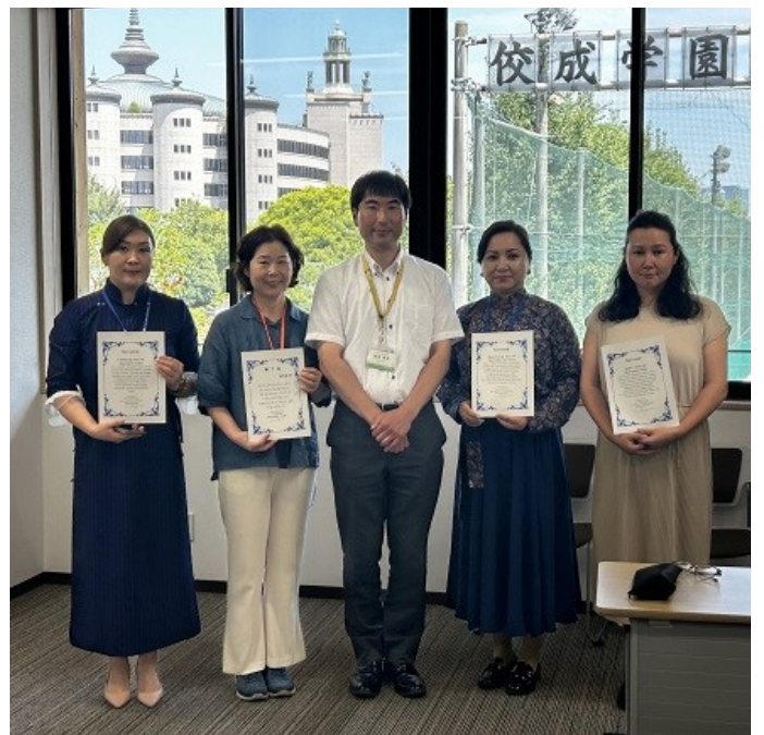
2025년 8월, 동아시아 간부 교육 후, 수료증을 받고 함께 교육에 참가한 동기들과 함께(왼쪽에서 두번째)

입정교성회의 가장 큰 매력은, 법화경의 가르침을 실천하면 모든 사람이 구제받고 행복해질 수 있다는 점입니다. 예를 들어, “내가 바뀌면 상대방이 바뀐다”는 가르침과 같이, 가르침을 꾸준히 실천하여 내가 바뀔으로써 저절로 ‘상대방이 바뀌고, 주위가 바뀌고, 환경이 바뀐다’고 생각합니다. 저 역시 입회 동기는 두 아들을 올바르게 키우고 싶다는 바람이었습니다. 그 후, 제가 부처님의 가르침을 가정에서 실천을 해서 덕분에 두 아들이 모두 고분고분 하고 따뜻한 마음을 가진 훌륭한 청년으로 성장해 준 것에 진심으로 감사하고 있습니다. 또한, 이전에는 경제적 어려움과 부부사이의 불화로 인해 남편과 이혼을 생각했었던 정도였습