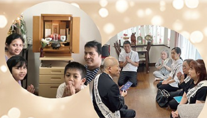
회원 집 방문

입정교성회 국제 불교 교회 (IBC) 마음을 잇는, 외국인을 위한 불교 커뮤니티