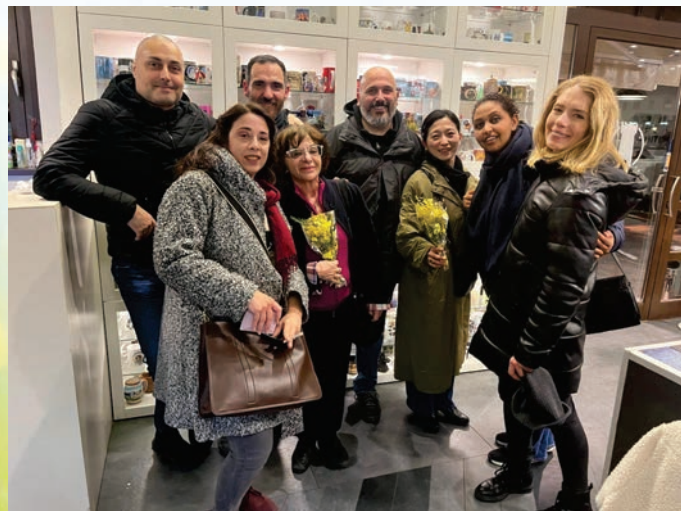
ローマ法座のサンガと (右から4人目)

우크라이나와 팔레스티나에서는 아직까지 전투가 장기화하며, 안타깝게도 세계는 분단과 대립이 진행되어 혼돈이 계속되고 있습니다. 이전의 협조님을 통해서 ‘입정교성회를 시작으로 법화경이 세계만국으로 퍼진다’는 신시(神示)가 있었습니다만, 저는 오늘 날이야 말로 입정교성회가 세계를 향해 법화경 가르침을 넓히는 사명과 역할이 있다고 깊이 느끼고 있습니다. 그러한 점들을 고려해서 지금 내가 가장 바라고 있는 것은 로마를 중심으로 한 승가의 결집과 성장발전을 목표로, 법화경을 포교해 나갈 것, 즉 우리들 각자가 부처님의 지혜와 자비를 몸에 익혀, 많은 사람들에게 가르침을 전해 나가는 것 밖에는 없습니다. 또한 이상은 아주 큼니다. 꿈은 로마에서 교회장 역할을 받는 것입니다. 그러기 위해서라도 매일 매일 수행 속에서 지금까지 이상으로 법화경을 배우고 실천함과 동시에 승가 여러분들과 힘을 합쳐 포교 전도에 노력하여, 많은 이탈리아 사람을 행복으로 인도해 나갈 수 있도록 정진해 나가겠습니다.