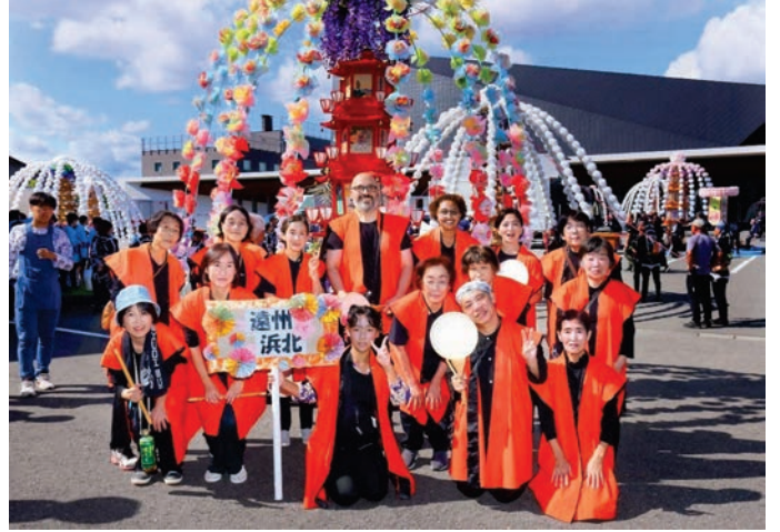
2025年10月12日、生誕地まつりに参加した浜北教会の会員と(後列中央)

며, 게다가 감사한 것이 회장선생님으로부터 ‘머리말’을 기고해 주실 예정입니다.