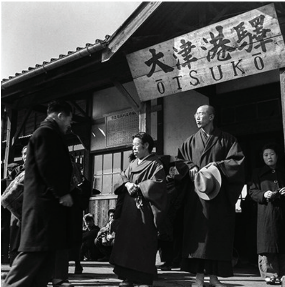
지방 포교에 나선 개조님과 협조님 (1952년, 이바라기현)

지금 일본에서 많은 사람이 가장 요구하고 있는 것이 무엇인가 생각해보면, 결국은 정신적인 평안함, 정신적인 풍요로움이라고 생각합니다. 그 중에서도 인간관계는 가장 큰 관심거리로 주위 사람과의 인간관계 속에서도 따뜻하고 부드러운 마음으로 대하고 싶다는 것이 많은 사람들의 바람일 것입니다.