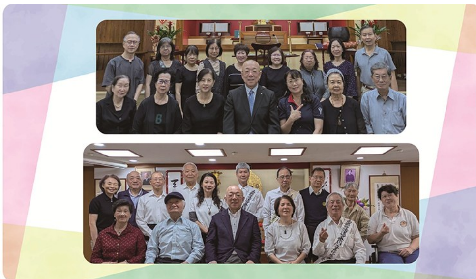
4月1日に台南教会(上)を、翌2日に台北教会(下)を訪問し、法座席で会員の皆さんと

私たちは「得ること」に幸せを求めがちですが、実は「与えること」、すなわち人を思う心の中にこそ、本当の幸せがあるのではないのでしょうか。本仏の慈悲の教えが示すように、小さな思いやりや一言の声かけが、相手の心をあたためると同時に、自分の心をも豊かにしてくれます。「この人のために」という一念がつながりを生み、他者だけでなく自分自身をも救い、私たちを真の幸福へと導いてくれるのではないのでしょうか。