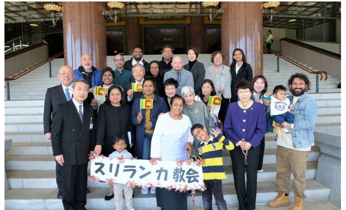
說法當日，與趕來大聖堂聲援的大家一起

斯里蘭卡有句諺語說：「即使牛車再慢，只要路是對的，就能到達目的地。」不需要急躁。只要積極向前，相信正確的教義並堅持走下去。向各位會員展示這樣的姿態，是我的修行。