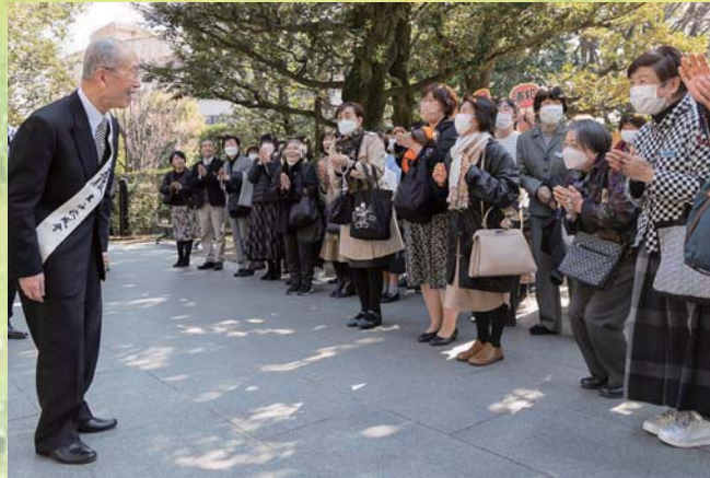
Поч. Ничико Нивано Претседател, Ришо Косеи-каи