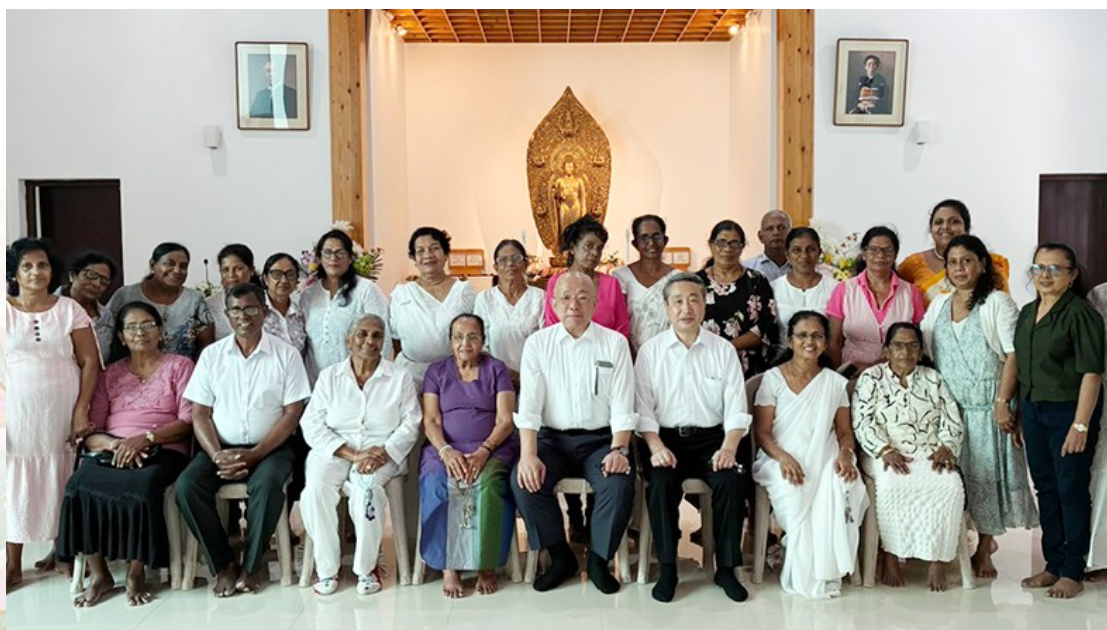
赤川教会長(前列右から3番目)の就任式のあと式典の参加者と