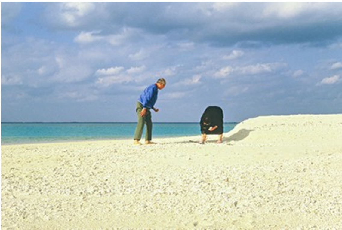
ภาพถ่ายท่านประธานใหญ่คู่กับภรรยา คุณนาโอโกะ ที่เกาะคูเมะ จังหวัดโอกินาวะ เมื่อปี 1984

ท่านประธานใหญ่ นิคเคียว นิวาโนะ ผู้ก่อตั้งริชโซโคเซไก