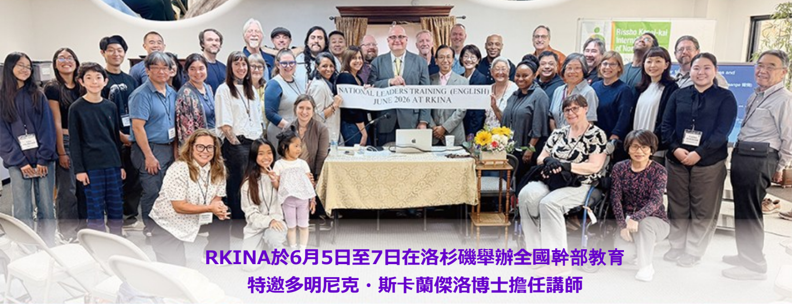
RKINA於6月5日至7日在洛杉磯舉辦全國幹部教育 特邀多明尼克·斯卡蘭傑洛博士擔任講師