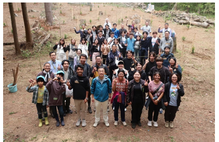
學林步道的團體照（前排右起第四位）