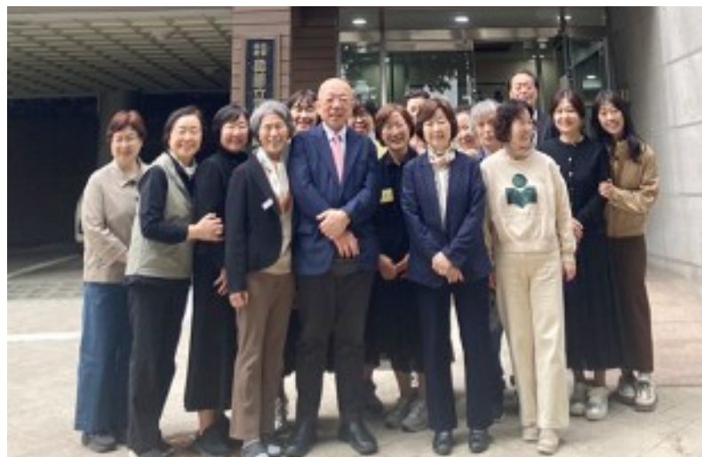
5月11日在韓國教會的大門入口前與會員們合影(前排中央)