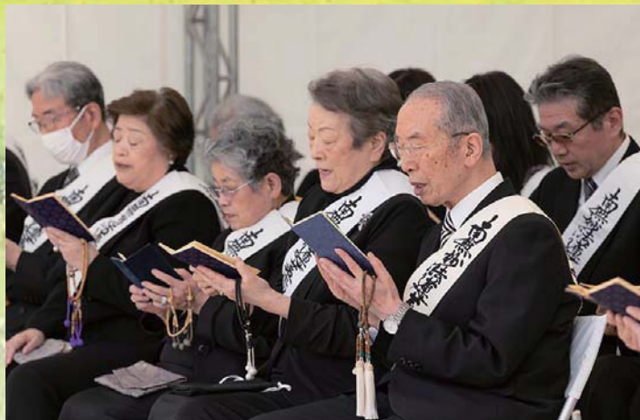
Поч. Ничико Нивано Претседател, Ришо Косеи-каи