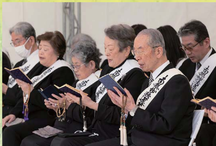
Rev. Nichiko Niwano Presidente Risho Kossei-kai