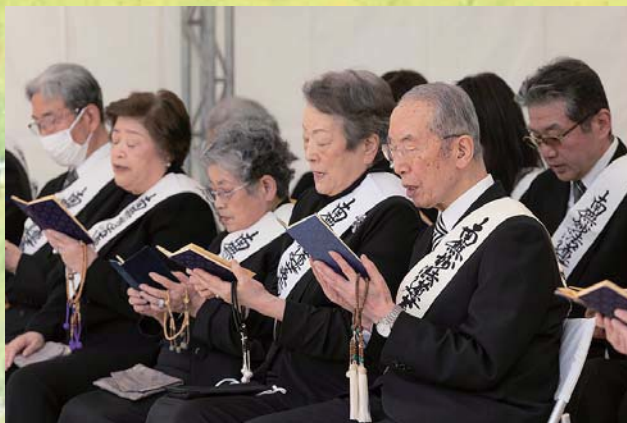
Нитико Нивано Президент общества Риссё Косэй-кай