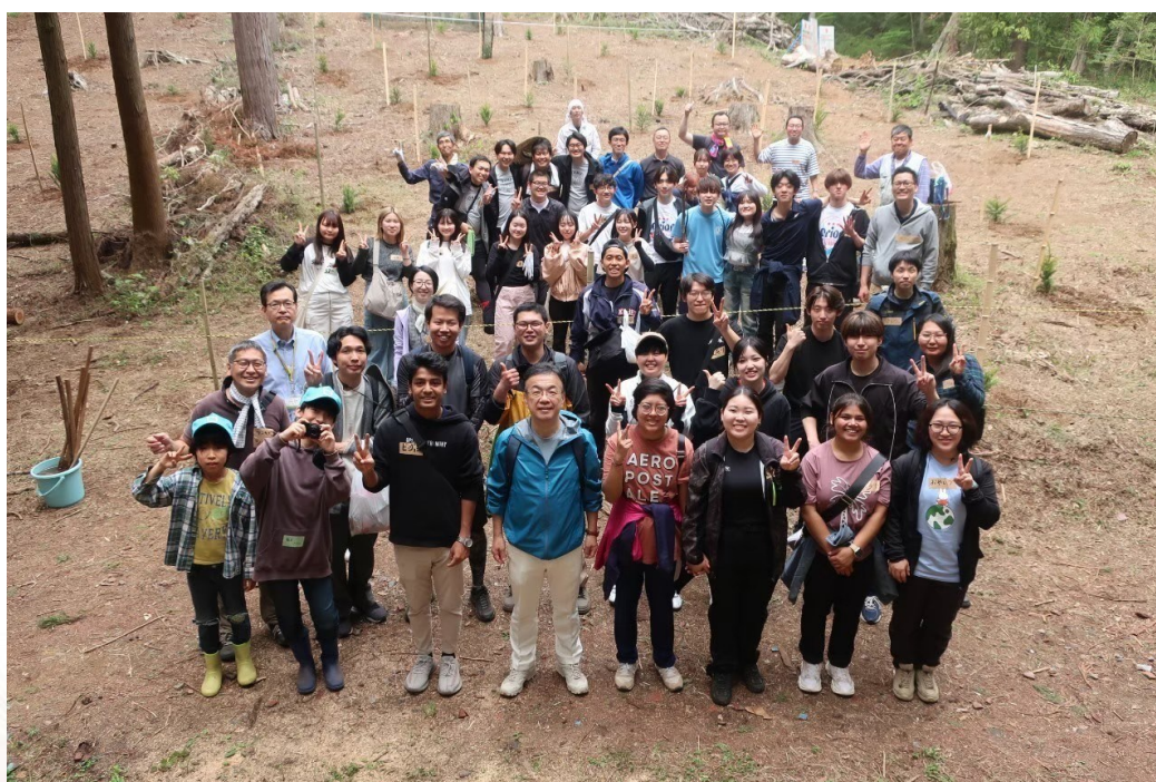
学林ウォークでの集合写真(前列右から四番目)

家庭の平和は個人の変化から始まり、その変化が家族関係を変え、社会や世界の平和に波及していくことを確信しました。その意味からも「自分が変われば相手が変わる」ということを心に銘記し、すべての人が幸せになれる法華経の教えを一人でも多くの人に伝えていくことを今後の修行目標とさせていきたいと思っています。