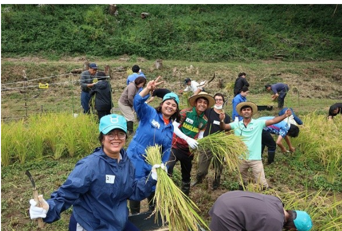
「穂掛祭」(稲刈り)で海潮音科の同期や後輩と

バングラデシュ教会では現在、主に子育て中のお母さん方を対象にして定期的に家庭教育セミナーを行なっています。このセミナーにこれから積極的にかかわらせていただくとともに、若者向けのワークショップや家庭教育プログラムを実施するなど、これまで家庭教育を学ばれたリーダーの皆さんと一緒にバングラデシュにおける家庭の平和づくりに少しでも貢献していきたいと思っています。