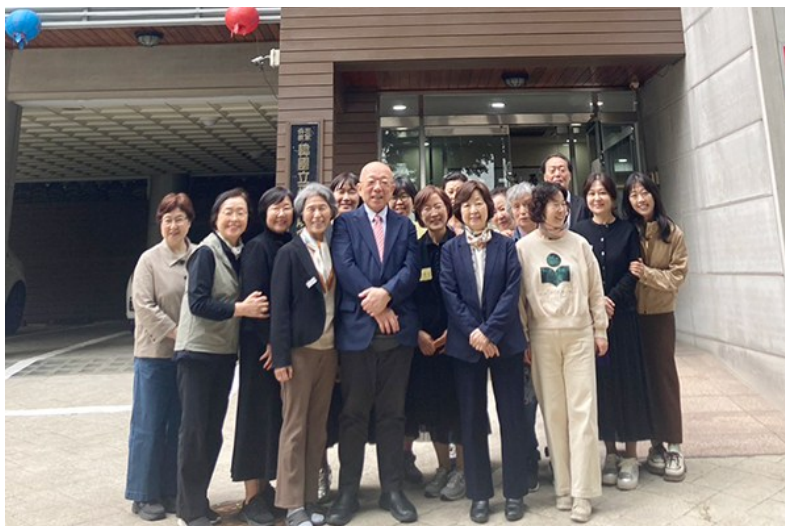
5月11日、韓国教会の玄関前で会員の皆さんと(前列中央)

今月も、「あなたに会えてよかった」という感謝の心で、一瞬一瞬の出会いを大切に、日々歩んでまいりたいと思います。